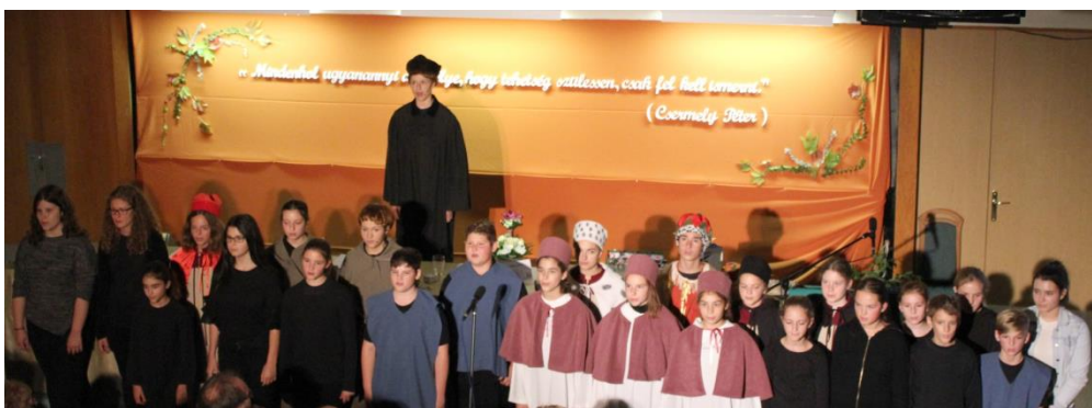
Benka Gyula Evangélikus Angol Két Tanítási Nyelvű Általános Iskola és Óvoda Szivárvány színjátszó tehetségműhelye