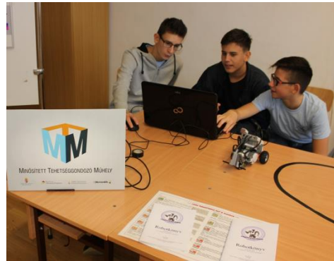
Orosházi Vörösmarty Mihály Általános Iskola robotika szakkörösei

kutató gyerekek tudományos konferenciájáról készült dolgozatokat, kreativitás fejlesztését a művészetekkel, 6hatós matematika, Feketén a hófehér jó gyakorlatokat. Elénk tárult a digitális ásványtár, 110 éves muzeális gyűjtemény és mozgásba jöttek a LEGO robotok is. Az Edison Klub is kitett magáért, a gyermekek által készített elektromos kisautót a konferencia résztvevői is kipróbálhatták.