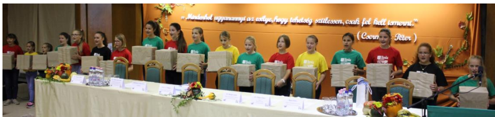
Benka Gyula Evangélikus Angol Két Tanítási Nyelvű Általános Iskola és Óvoda énekkara