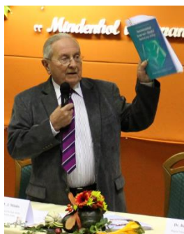
Prof.F.J. Mönks, aEuropeanCouncilforHighA bility örökös elnöke

Prof.F.J. Mönks, aEuropeanCouncilforHighAbilityörökös elnöke George Betts könyvét ajánlja minden tehetséggondozással foglalkozó szakembernek, mely az Autonóm Tanulói