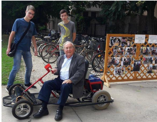
Prof.F.J. Mönks, aEuropeanCouncilforHighAbility örökös elnöke kipróbálta az Edison Klubosok járművét

A második nap programjában ötvöződött az elmélet és a gyakorlat. Gazdag műhelymunkáról tanúskodtak a szekciók és azok tartalmi munkájáról a műhelyek, így kapott helyet az óvodai, az általános iskolai és a középiskolai szekció. Betekintést nyertünk a kiváló tehetségműhelyek munkájába, láthattunk szakmai innovációkat tartalmazó kiadványokat, csengettyűsöket,